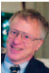
Navn: Georg Akerlof Alder: 71 Bakgrunn: Nobelprisvinner og professor ved Berkely University of California

Det finansielle systemet som eksisterte i 2007 var svært skjørt og kunne ikke tåle mye stress. Spørsmålet er om det er mindre skjørt nå, og hvis så, hvor mye mindre skjørt er det? Det var mange mennesker som i 2007 trodde at det skjedde fra 2007 til 2009 ikke kunne skje. Jeg vil gjette på at det var majoriteten. Jeg tror det er viktig at folks forståelse at det kan skje igjen. Forhåpentligvis vil det ikke bli så ille hvis det skjer igjen, og forhåpentligvis er det en liten sannsynlighet for at det skjer. Folk må lære at dette er et svært komplekst system, mer komplekst enn vi noen gang før har sett i verden.