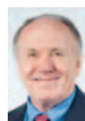
Navn: Edward C. Prescott Alder: 71 Bakgrunn: Nobelprisvinner, professor ved Arizona State University og Senior Monetary

holdbar, balansert og human økonomisk vekst, er nøkkelen til reform i mikroøkonomien. Det er å få til fleksibilitet og bli kvitt gale incentivstrukturer i næringslivet. Dette er ting som er langt mer komplekse å få til enn de store budsjett- og pengepolitiske tiltakene som folk umiddelbart tenkte på som respons på depresjonen.