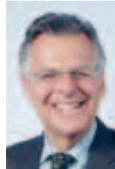
Navn: Myron S. Scholes Alder: 70 Bakgrunn: Nobelprisvinner og professor ved Stanford University

Hva er den viktigste lærdommen av finanskrisen? Dagens Næringsliv har stilt spørsmålet til 13 av verdens fremste økonomiske eksperter. Tre år etter at investeringsbanken Lehman Brothers gikk konkurs og utløste en verdensomspennende finanskriser, er dette ekspertenes viktigste innsikt.