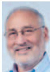
Navn: Joseph E. Stiglitz, Alder: 68 Bakgrunn: Nobelprisvinner og professor ved Columbia University

Myndigheter er noe dritt. De bør sette opp et system hvor långivere og låntagere bærer risikoen. Man bør ha nøytralitet. Aksjer, aksjer, aksjer. 100 prosent reservekrav. Fjern institusjoner som både låner mye og som låner ut mye, de som pådrar seg mye gjeld, spekulantene som blir for store til å gå konkurs. Det brukes for mye penger. Å bruke penger er å skattlegge. Å skattlegge er å kvele økonomien. Det var akkurat det som skjedde.