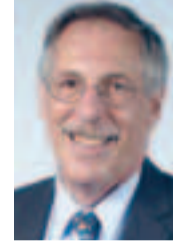
Navn: Peter A. Diamond Alder: 71 Bakgrunn: Nobelprisvinner og professor ved Massachusetts Institute of Technology

Ekspert på arbeidsmarkeder og andre markeder med friksjoner – Jeg jukser, jeg har to lærdommer. Den første er at vi har behov for et grundig tilsyn av finansinstitusjoner, et tilsyn som er mye strengere enn det vi hadde tidligere. Det andre er at hvis land skal ha rom til å stimulere økonomien via offentlige budsjetter er det viktig at gjelden ikke løper løpsk.