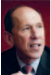
Navn: Kenneth R. French Alder: 57 Bakgrunn: Professor ved Tuck School of Business

Ekspert på prising av verdipapirer og investeringsstrategier Den viktigste lærdommen for meg var hvor skjørt det finansielle sys-