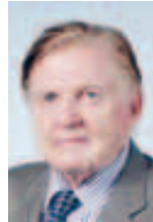
Navn: Robert A. Mundell Alder: 79 Bakgrunn: Nobelprisvinner og professor ved Columbia University

fullstendig rasjonelle, likevel selvpåfyllende, reaksjoner på tvilen om finansielle institusjoner ville overleve. De verdifulle forsikringsordningene som ble innført for å beskytte bankinnskudd ble innført av tilsynsmyndighetene nettopp for å eliminere klassiske bankkjør, hvor kundene trekker ut innskuddene sine. Det er viktig at tilsynsmyndigheter verden over finner like effektive måter å eliminere moderne bankkjør.