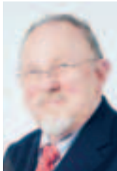
Navn: William F. Sharpe Alder: 77 Bakgrunn: Nobelprisvinner og professor ved Stanford University

Myndighetene og andre bør ikke si at økonomien fundamentalt sett er veldig sunn, vi forstår risiko, pengepolitikken virker, alt virker. Hvis de gjør det tar folk mer risiko, fordi de føler seg mer trygge. Så ikke demp volatiliteten. La det bli nok resesjoner og gode tider som er små, slik at vi ikke glatter ut alt og får en stor smell. Vi trenger nok sjokk, slik at folk er forsiktige. Så ikke forsøk å glatte det ut.