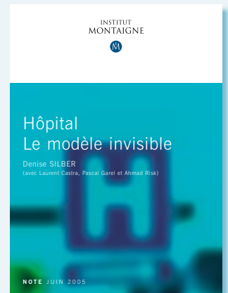
Hôpital : le modèle invisible par Denise SILBER et al.