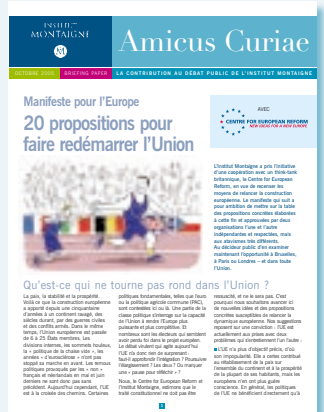
Manifeste pour l'Europe 20 propositions pour faire redémarrer l'Union