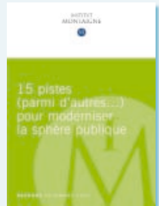
15 pistes (parmi d'autres...) pour moderniser la sphère publique

L'Amicus Curiae est téléchargeable sur le site www.institutmontaigne.org